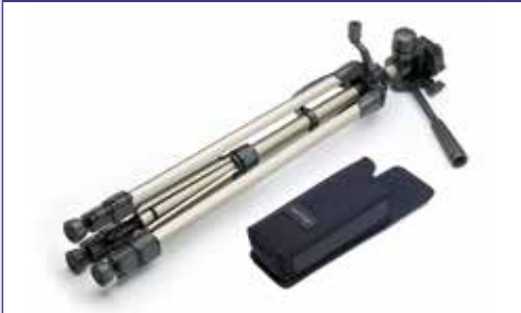
Adaptador para trípode, trípode, certificado de calibración, funda para el cinturón.