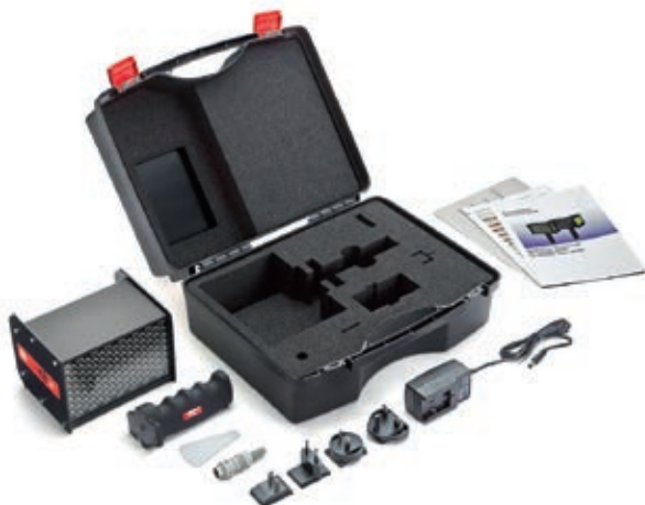
Betriebsanleitung, Kalibrierungszertifikat, Ladenetzteil mit Steckersatz, Triggerstecker, Reflexmarken (Version super qbLED), Griff, Koffer.

„Impuls-Teiler (DIV)“: Mit dem Impuls-Teiler kann ein Wert x eingestellt werden. Das externe Triggersignal wird dann durch diesen Wert dividiert. Beispiel: Ein externer Trigger (z.B. Drehzahlsensor), der ein Zahnrad abtastet, liefert bei jedem Zahn ein Signal. Bei DIV-Wert = 10 wird nur bei jedem 10. Signal geblitzt.